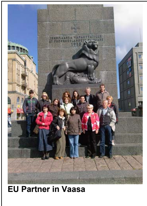
EU Partner in Vaasa